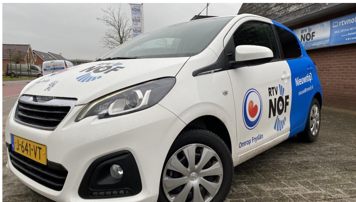
De gezamenlijke auto voor de basisredactie is een opvallende verschijning in de regio.

Daarnaast is het radio- en tv signaal ook te vinden via internet en streams in onze app. De streekomroep heeft daar zelf voorzieningen in getroffen waarmee middels streaming naar mobiel, internet en laptops het radiosignaal wereldwijd te beluisteren is. We merken dat er steeds meer mensen via deze manier naar RTV NOF luisteren en/of kijken. Er is echt een verschuiving gaande van analoog (dit zal in 2021 door Ziggo niet meer worden ondersteund) naar digitaal, vandaar dat de Uitzending Gemist pagina op www.rtvnof.nl ontzettend veel traffic scoort, mensen kunnen daar op hun eigen tijd en gemak programma's terugluisteren.