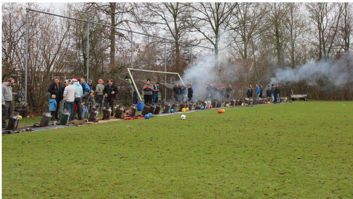
Op Oudjaarsdag zijn diverse reportage-teams te vinden in de regio bij het carbidschieten.