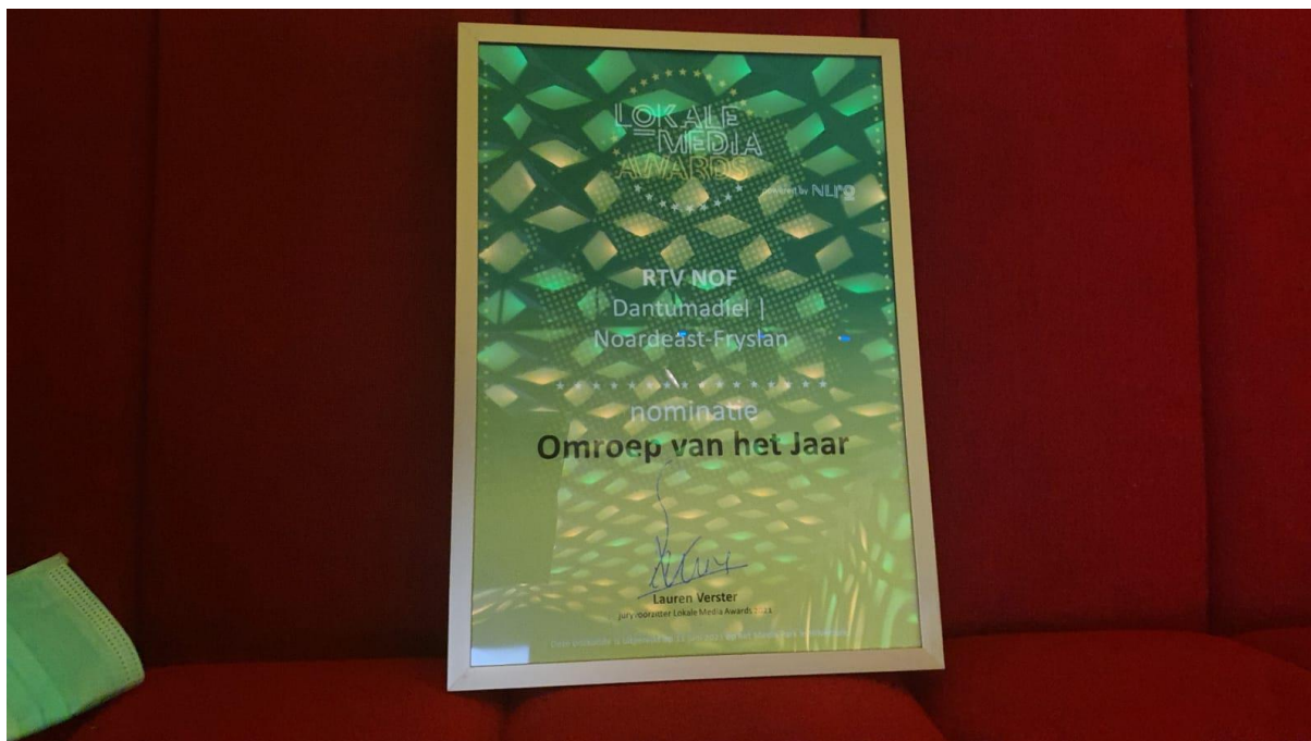
Eervolle vermelding voor Streekomroep RTV NOF bij Omroep van het Jaar verkiezing 2021